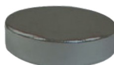
Aimants Samarium Cobalt cylindriques